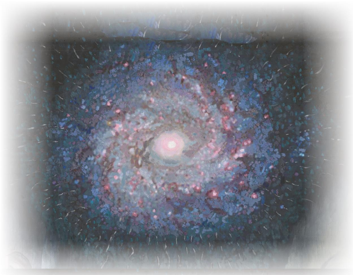
Bild 2: Ausschnitt aus dem Gemälde "Die neue Zeit" von Claudia Winkler